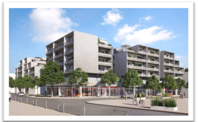
SIRIUS MONTAUDRAN A PARTIR DE 128 299€