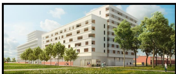
Azur quartier Empalot livraison 2025 1

- Neuf : Azur (en construction), Clos Gersois et Terre des Hommes qui sont au tout début de leur commercialisation en location accession