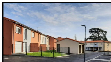
Bouloc - Villas livrées 1

API Days – Vendredi 26 et Samedi 27 avril 2024 de 10H à 19H non stop